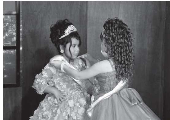
Coronando a Miss Pequeñita Nayarit 2020.